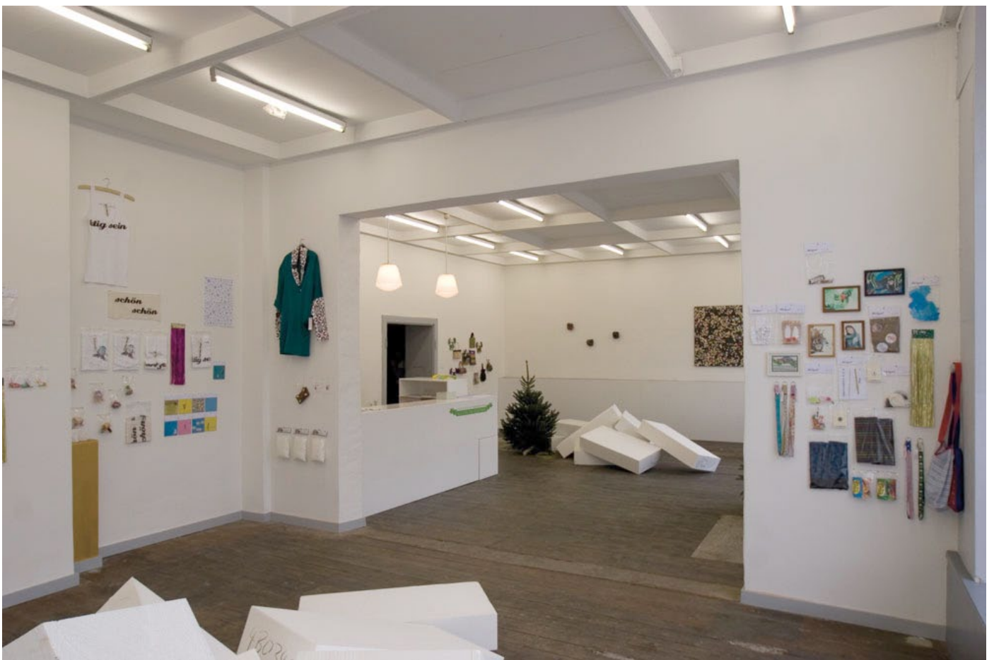
Ausstellung All you can schenken · Galerie dieschönestadt, Halle · 2008