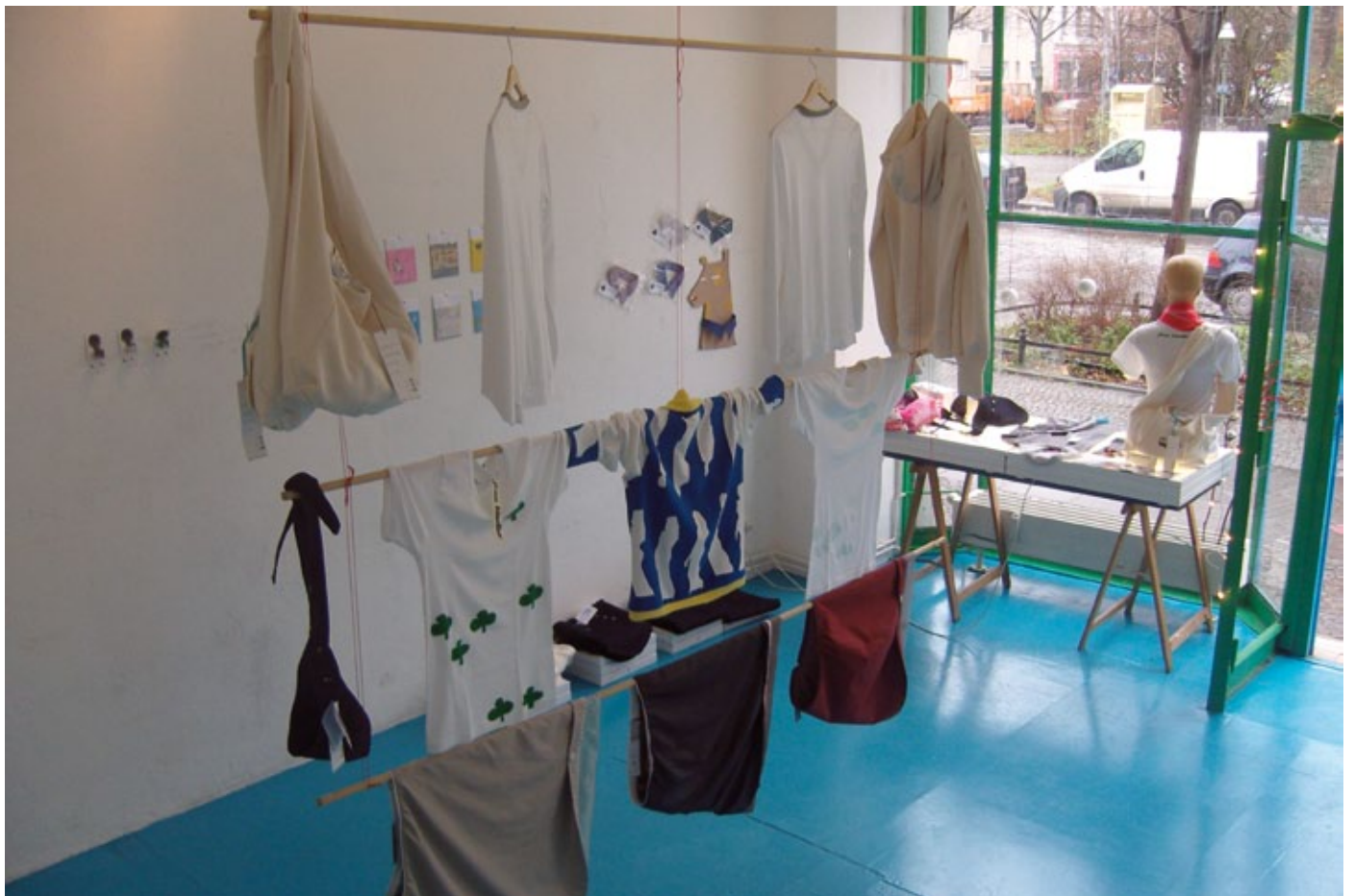
Ausstellung All you can schenken · Showroom Reichenberger, Berlin · 2008