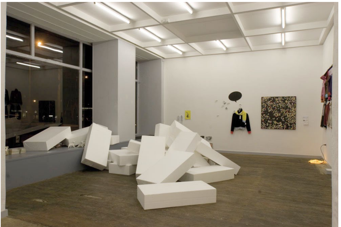
Ausstellung All you can schenken · Galerie dieschönestadt, Halle · 2008